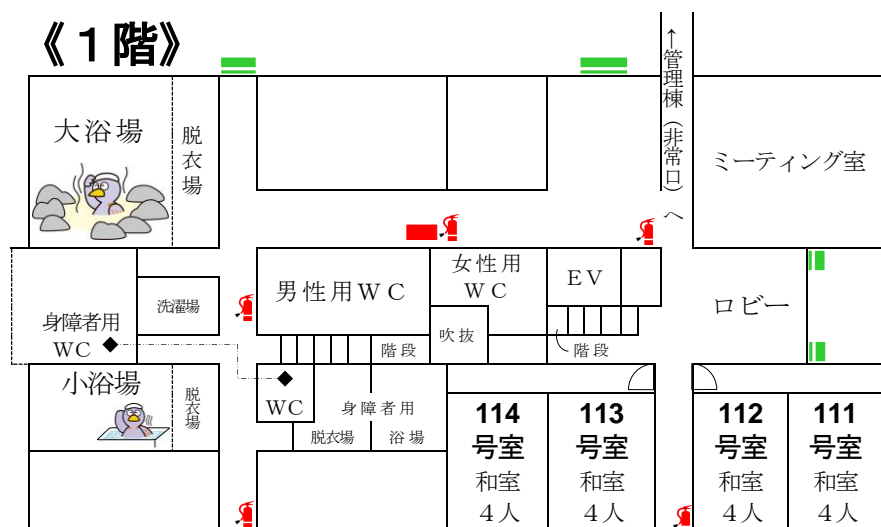
施設名と利用可能人数